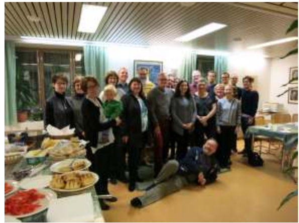
Suzukiopettajien yhteinen illanvietto opistolla päätti tapahtuman.

guitar. I've got my master's degree from Cleveland's Institute of Music. I'm a teacher trainer of the Suzuki Association of the Americas and the European Suzuki Association as well. We have a course in Ireland. It has been ongoing for four years now.