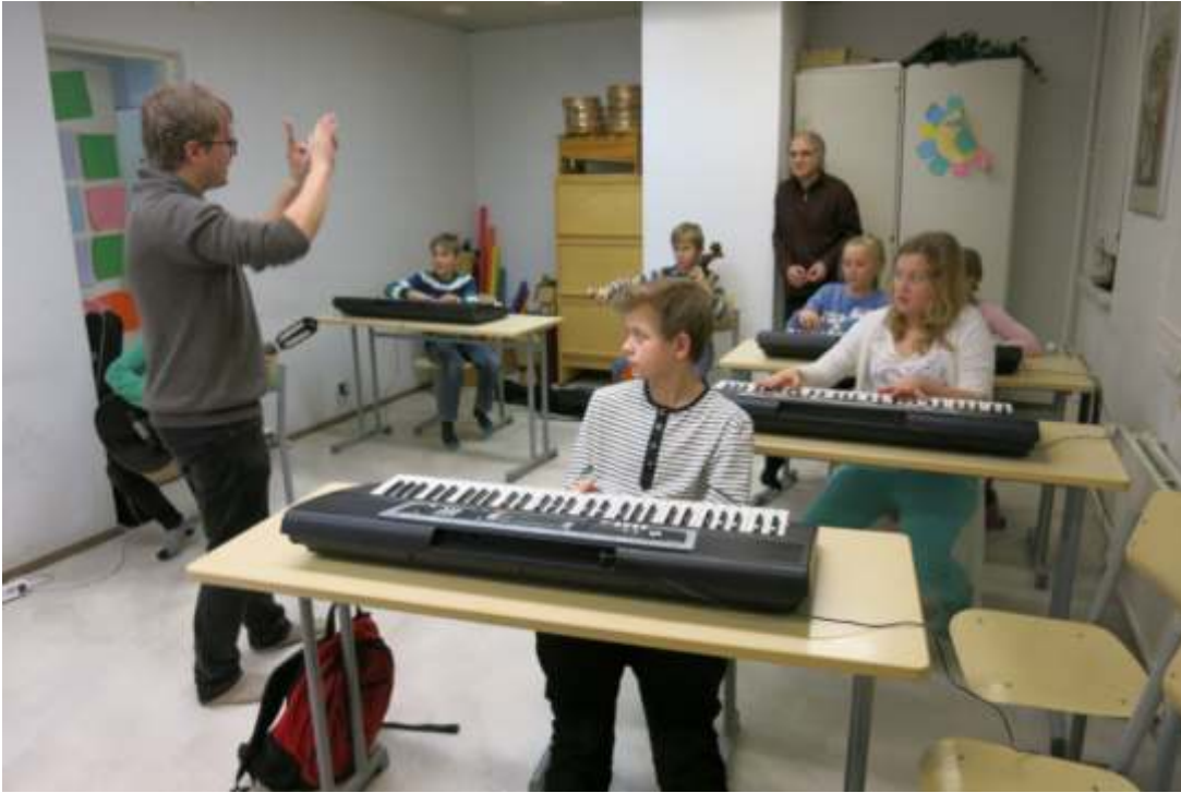
Sound painting-paja mupeluokassa