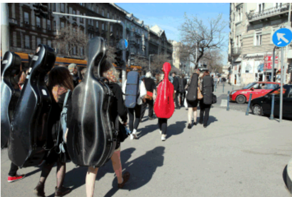
Ensimmäiselle keikalle lähdössä. Sää suosi matkalaisia; auringon lämmössä sellojakin oli kevyempi kantaa...