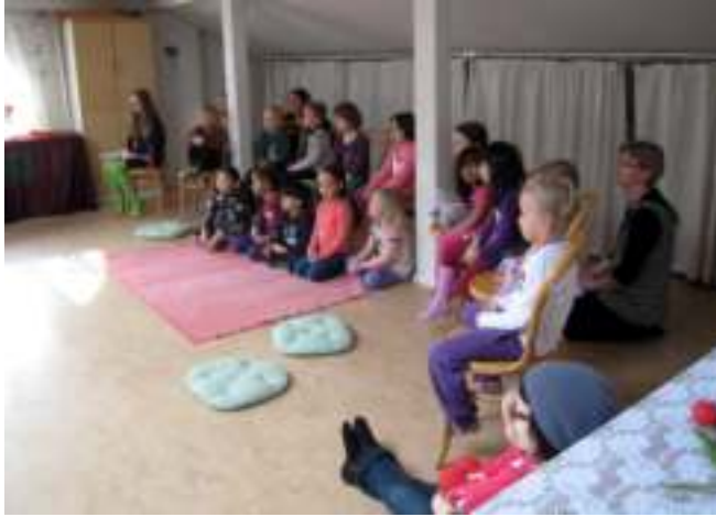
Eskariryhmät olivat aivan loistava yleisö, hyviä kuuntelemaan ja keskittymään!