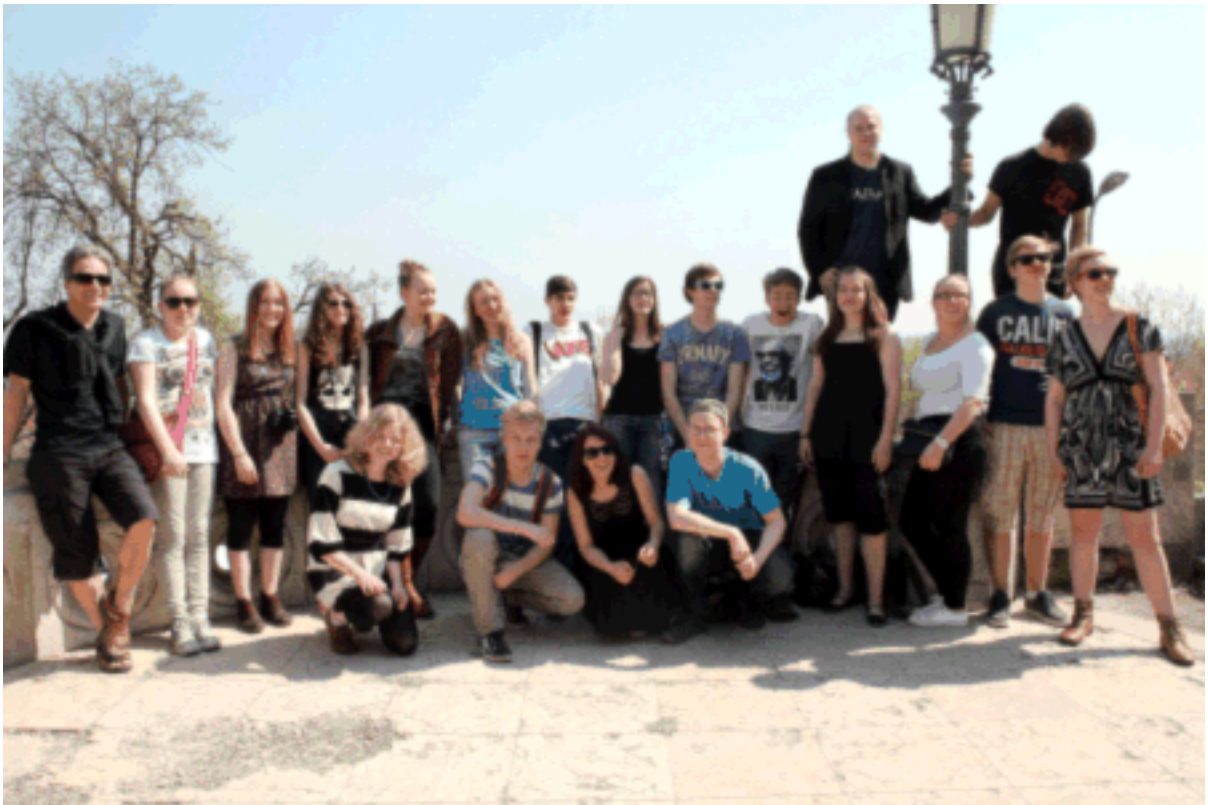
Budan linnoituksen luota.