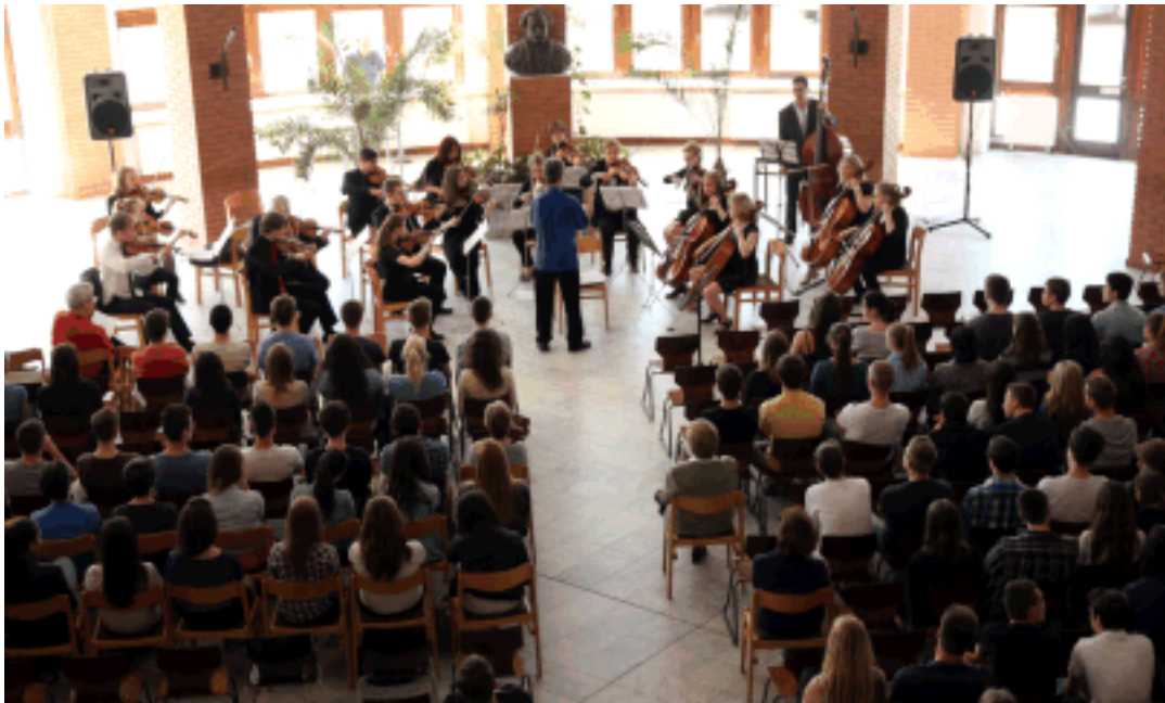
Ensimmäinen konsertti Móricz Zsigmond Gimnáziumin aulaassa.