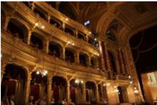
Viimeisen illan ohjelmaan kuului Budapestin filharmonikkojen konsertti Unkarin valtionoopperassa.