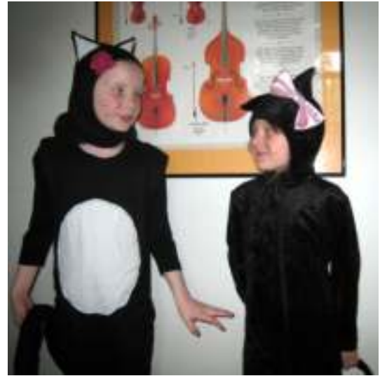
Kissojen runo sujui vuoropuheluna.