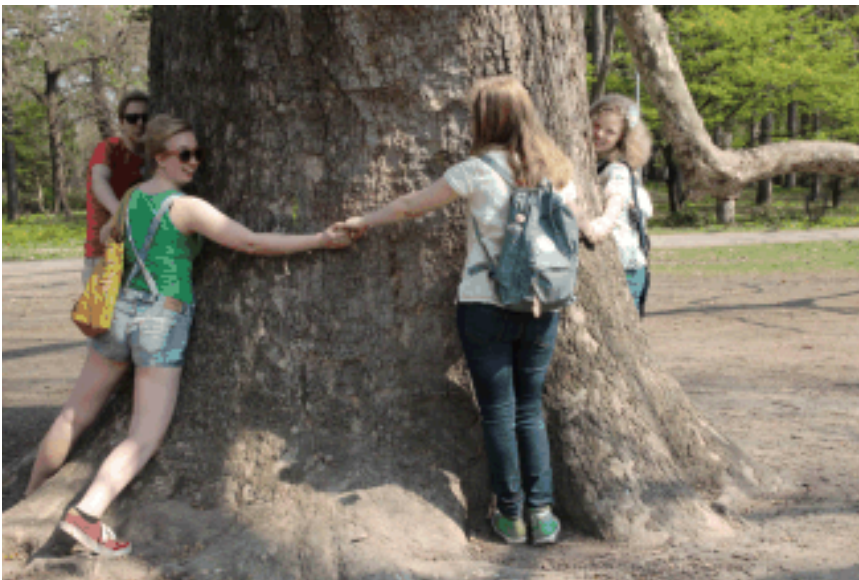
Margit-saaren puuvanhus Tonavan keskellä. Viisi käsiä tarvittiin ulottumaan sen ympäri!

Matkan viimeinen konsertti oli maanantai- päivänä Budapestin lähiöalueella Nádasy Kálmán koululla.