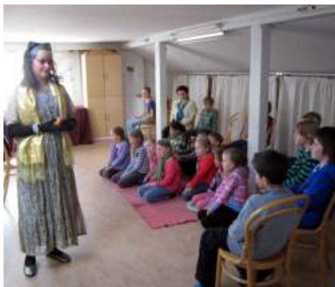
Kissa Krumeluu: "...puuta vain kun ravistaa, sata hiirtä putoaa!..."