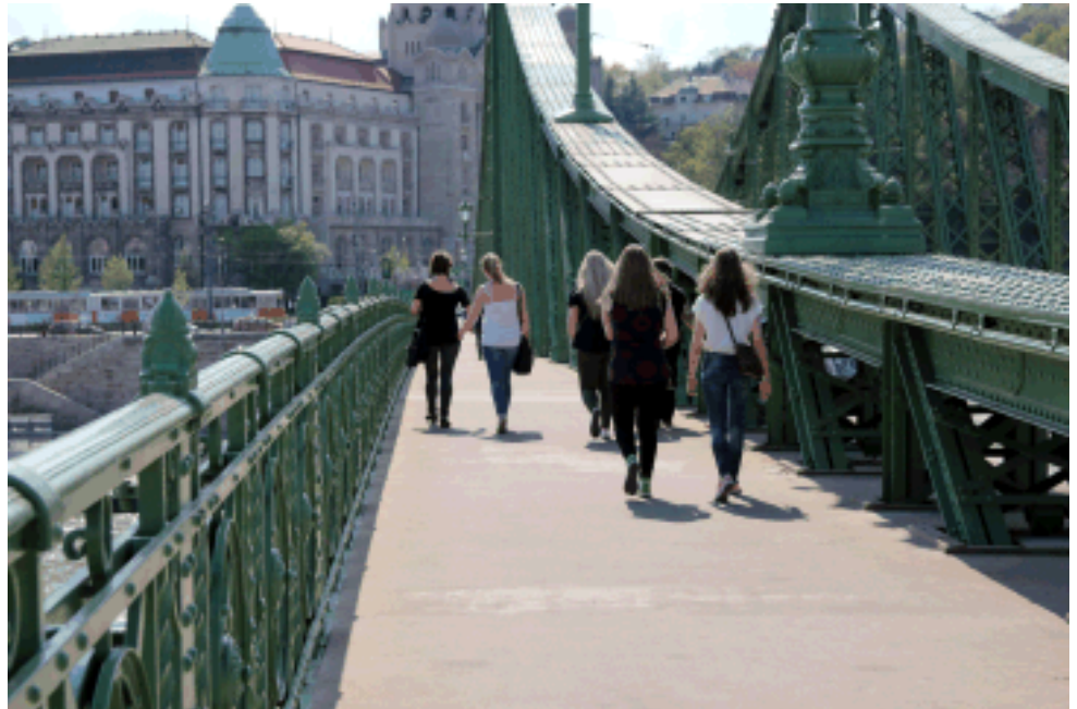
'Donau die blau' ja eräs silloista sen yli.