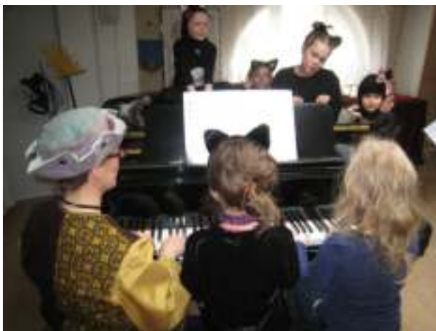
Mustan kissan tango 6-kätisesti!

Ryhmät saapuivat kuoriutumaan ulkovaatteistaan ala-aulaan, josta oven auettua huilunsoitto houkutteli heidät ylös aina Ranskalaiseen saliin asti. Siellä odotti ensimmäinen soitinarvoitus; ja muuttuihan se piano flyygeliksi vähän houkuttelemalla, kaikilta ryhmiltä.